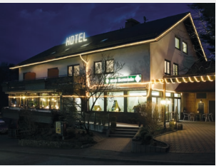
Gasthof „Zum Bernstein“ Fam. Uwe Rieger