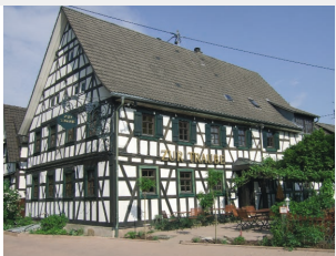
Flammaurant „Zur Traube“ Wolfgang Weber