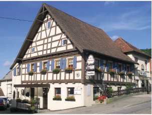
Landgasthaus „Kreuz“ Theo Siebers