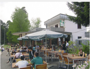
Sportgaststätte „Murgtalblick“ Anestis Emmanouil